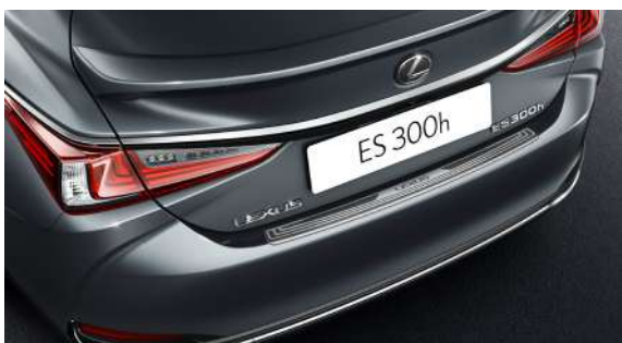
Захисна накладка заднього бампера з нержавіючої сталі та логотипом Lexus