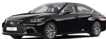
223, Чорний графіт