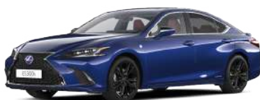
8X1, Синій сапфір*