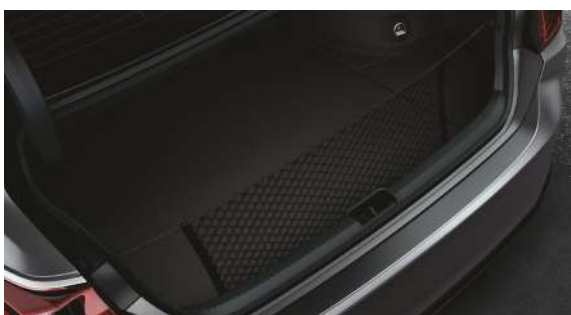
Вертикальна сітка кріплення вантажу