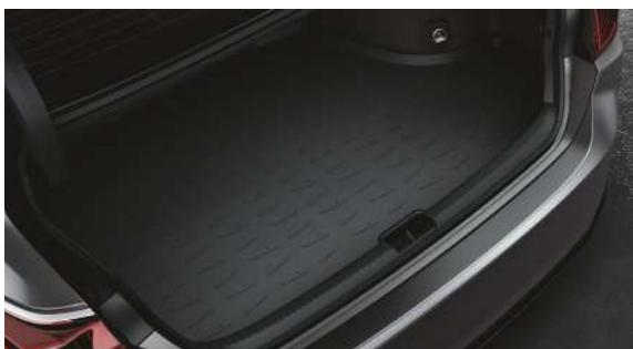
Килимок багажника, гумовий