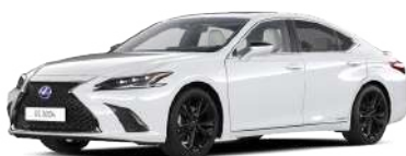
083, Білий F sport*