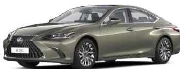
6X0, Сонячний зелений