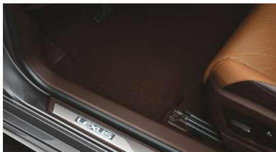
Накладки порогів з ілюмінацією, коричневі