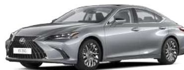
1L2, Платиновий сірий