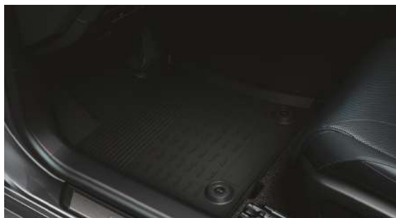
Килимки салону, гумові