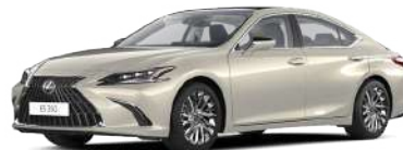
4X8, Крижаний бежевий