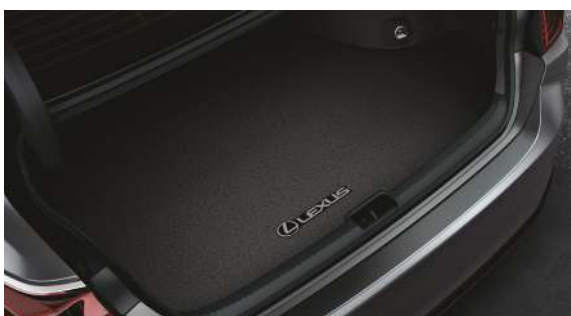
Килимок багажника текстильний, чорний