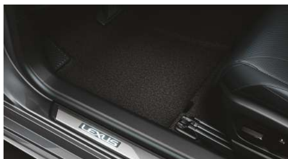
Накладки порогів з ілюмінацією, чорні