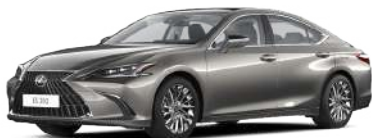
1J7, Титановий сірий