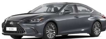
1L1, Хромовий сірий

* Кольори, доступні лише для комплектації F Sport Design