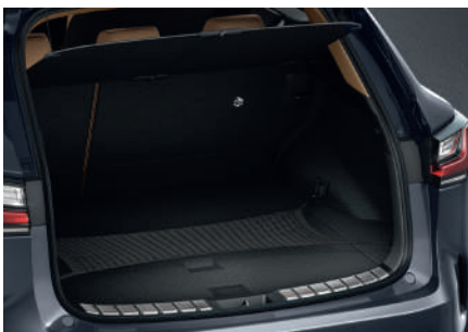
Сітка для багажника горизонтальна