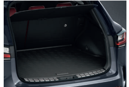
Гумовий піддон багажника