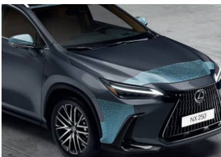
Комплект захисних плівок кузова