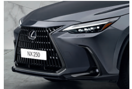
Декоративна накладка переднього бамперу