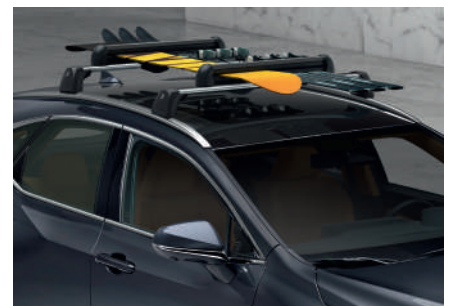
Поперечини даху та кріплення для лиж та сноуборду