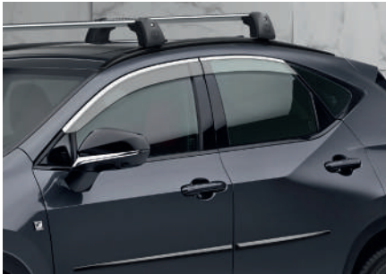
Дефлектори вікон з хромованим окантуванням