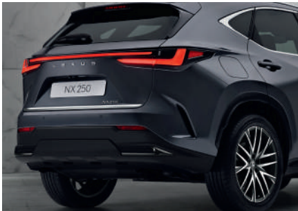
Декоративна накладка дверей багажника