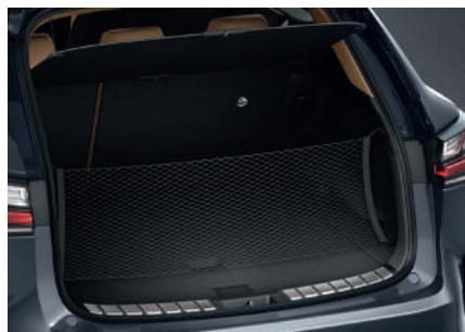
Сітка для багажника вертикальна