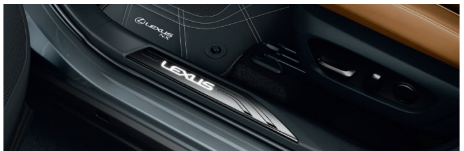
Накладки порогів з підсвіткою

Вся інформація, представлена у цьому буклеті, є точною та дійсною станом на дату публікації: 04.05.2023.